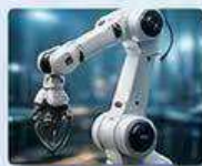
機器人關節 ROBOT JOINTS