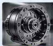
RV減速機 RV REDUCERS