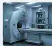
醫療器械 MEDICAL DEVICES