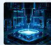
半導體設備 SEMICONDUCTOR EQUIPMENT