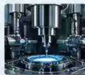
精密設備 PRECISION EQUIPMENT