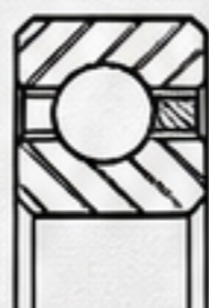
C系列 3/8" x 3/8"