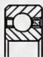
A系列 1/4" x 1/4"