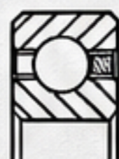
B系列 5/16" x 5/16"