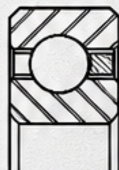
D系列 1/2" x 1/2"