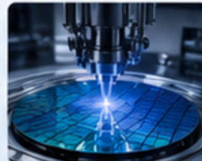
半導體設備 SEMICONDUCTOR EQUIPMENT