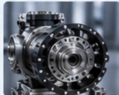
RV減速機 RV REDUCERS