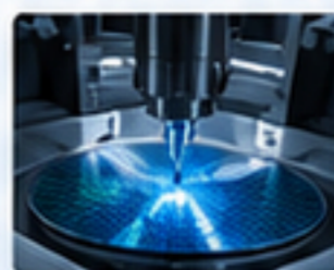
半導體設備 SEMICONDUCTOR EQUIPMENT