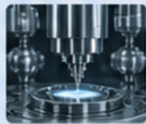
精密設備 PRECISION EQUIPMENT