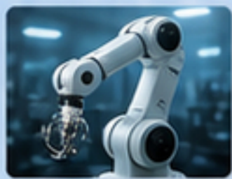
機器人關節 ROBOT JOINTS