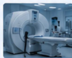
醫療器械 MEDICAL DEVICES