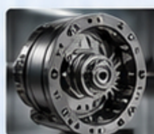
RV減速機 RV REDUCERS