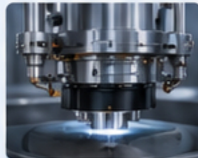
精密設備 PRECISION EQUIPMENT