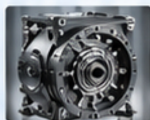
RV減速機 RV REDUCER