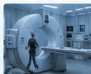
醫療器械 MEDICAL DEVICES