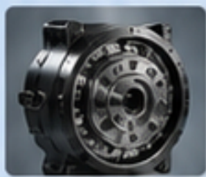
RV減速機 RV REDUCERS