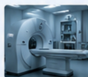
醫療器械 MEDICAL DEVICES