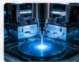
半導體設備 SEMICONDUCTOR EQUIPMENT