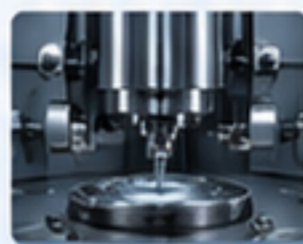
精密設備 PRECISION EQUIPMENT