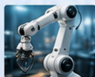
機器人關節 ROBOT JOINTS