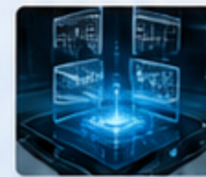
半導體設備 SEMICONDUCTOR EQUIPMENT