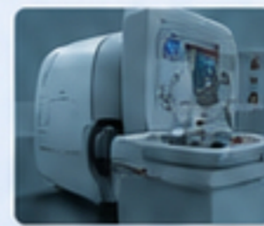
醫療器械 MEDICAL DEVICES