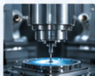
精密設備 PRECISION EQUIPMENT