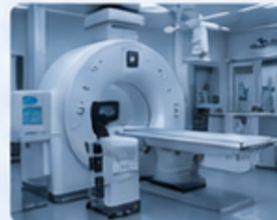
醫療器械 MEDICAL DEVICES