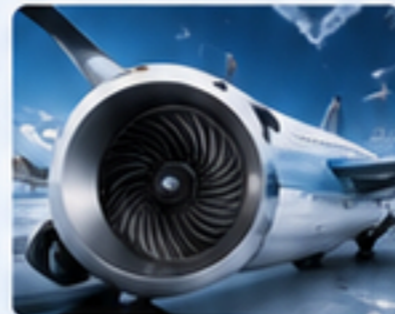
航太領域 AEROSPACE APPLICATIONS