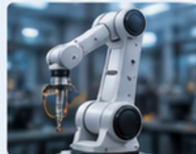
機器人關節 ROBOT JOINTS