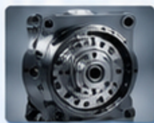
RV減速機 RV REDUCER