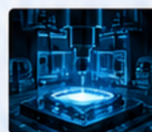
半導體設備 SEMICONDUCTOR EQUIPMENT