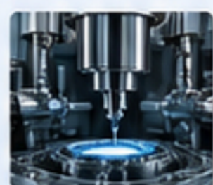
精密設備 PRECISION EQUIPMENT